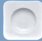
3 Suppenteller 23 cm eckig Plate 23 cm deep square Assiette creuse 23 cm carrée Piatto fondo 23 cm quadrato