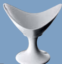
23 Schale 19 cm auf Fuß Dish 19 cm footed Coupe 19 cm sur pied Coppa 19 cm con piede