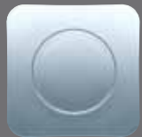
24 Platzteller 32 cm eckig Service plate 32 cm square Assiette présentation 32 cm carrée Piatto segnaposto 32 cm quadrato