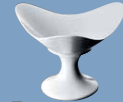
22 Schale 32 cm auf Fuß Dish 32 cm footed Coupe 32 cm sur pied Coppa 32 cm con piede