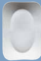
11 Platte 27 cm eckig Platter 27 cm angular Plat 27 cm rectangulaire Piatto 27 cm rettangolare