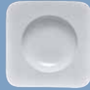
4 Pastateller 29 cm eckig Pasta plate 29 cm square Assiette pasta 29 cm angulaire Piatto pasta 29 cm quadrato