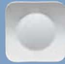
1 Frühstücksteller 21 cm eckig Breakfast plate 21 cm square Assiette petit déjeuner 21 cm carrée Piatto frutta 21 cm quadrato