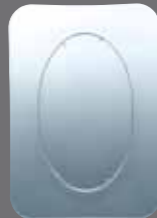
26 Platte 39 cm eckig Platter 39 cm angular Plat 39 cm rectangulaire Piatto 39 cm rettangolare