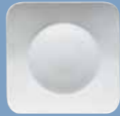
2 Speiseteller 27 cm eckig Plate 27 cm square Assiette plate 27 cm carrée Piatto piano 27 cm quadrato