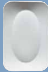
12 Platte 32 cm eckig Platter 32 cm angular Plat 32 cm rectangulaire Piatto 32 cm rettangolare