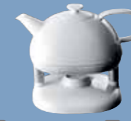
19 Kombi-Kanne Combi pot Verseuse Teiera