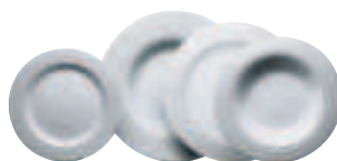
»WHITE ON WHITE«