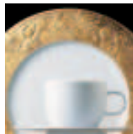
»SARASTRO« Decor: Bjørn Wiinblad